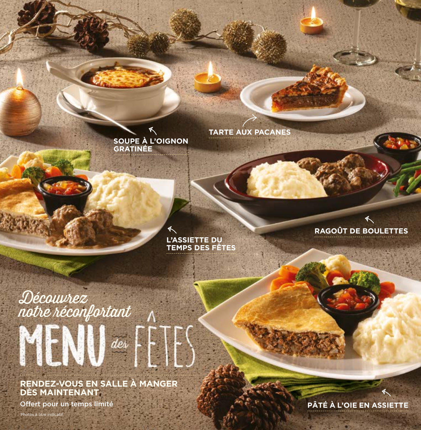
SOUPE À L'OIGNON GRATINÉE