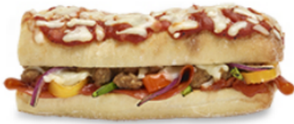
Pizza Sub deluxe