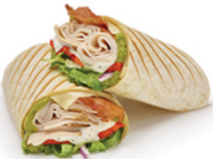
Wrap Signature Dinde, bacon et guac

Certains articles ne sont pas offerts dans tous les marchés. Détails en restaurant.