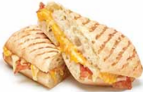
Fromage fondu et bacon