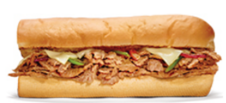
Steak et fromage