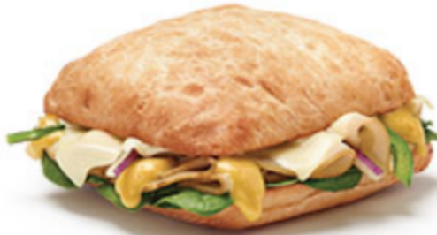
Rapido Grillé à la dinde à 4$

Certains articles ne sont pas offerts dans tous les marchés. Détails en restaurant.