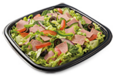
Combiné de viandes froides