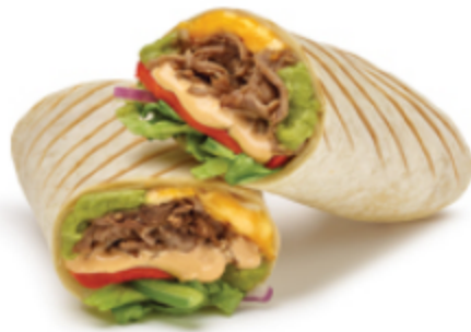
Wrap régulier Steak et guac sud-ouest