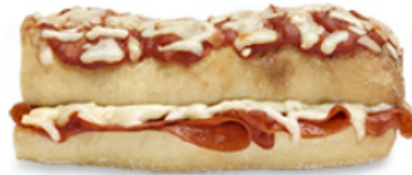
Pizza Sub pepperoni