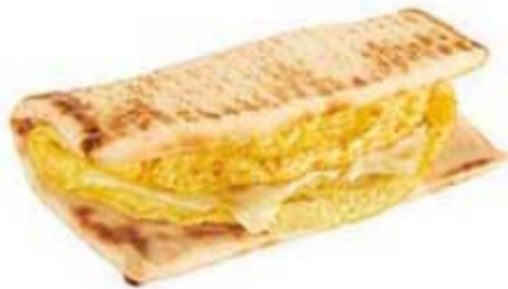
Oeuf et fromage