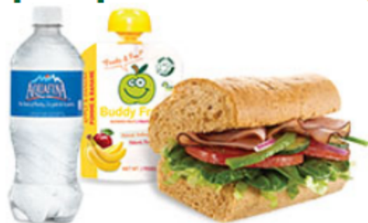
Jambon Forêt Noire