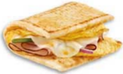
Jambon Forêt Noire, œuf et fromage

Certains articles ne sont pas offerts dans tous les marchés. Détails en restaurant.