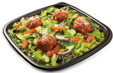
Boulettes de viande marinara