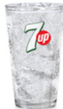
7Up® Boisson en fontaine