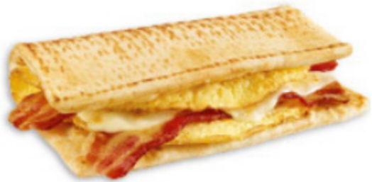
Bacon, œuf et fromage