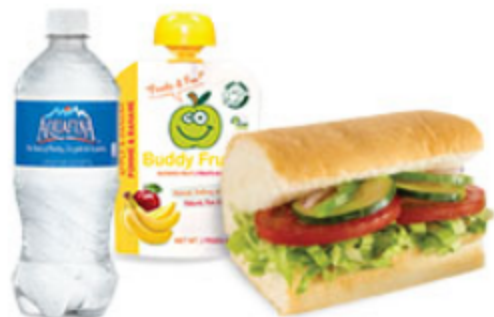
Végé-délice □ □

Certains articles ne sont pas offerts dans tous les marchés. Détails en restaurant.