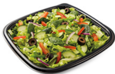
Végé-délice □ □