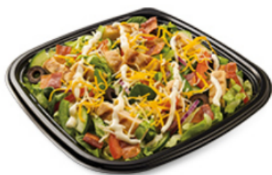
Ranch poulet et bacon