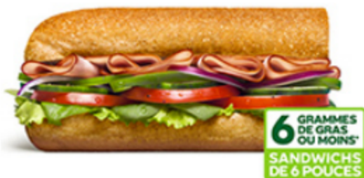
Jambon Forêt Noire