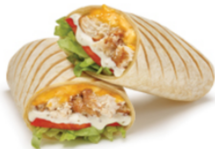
Wrap régulier Poulet César