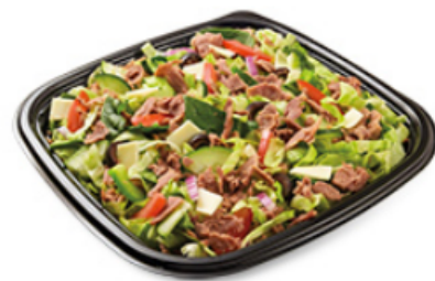
Steak et fromage