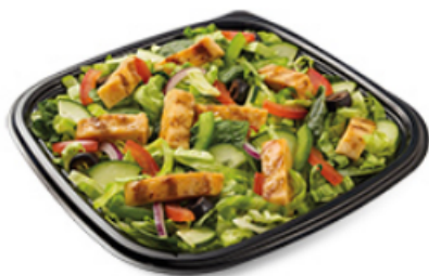
Poulet teriyaki aux oignons doux