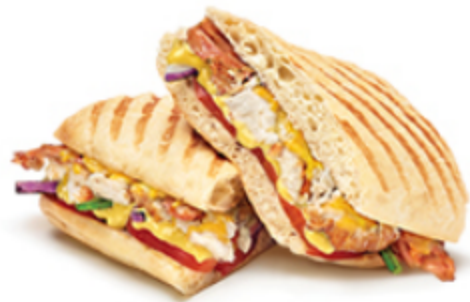
Poulet à la moutarde fumée au miel

Certains articles ne sont pas offerts dans tous les marchés. Détails en restaurant.