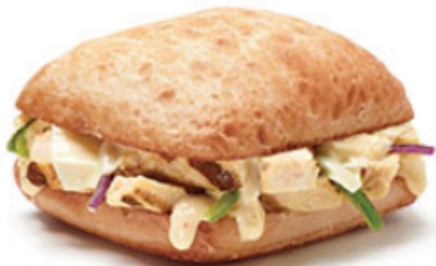
Rapido Grillé au poulet à 4$