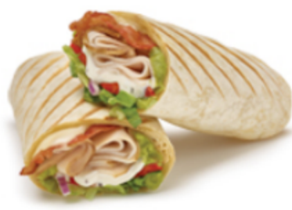
Wrap régulier Dinde, bacon et guac