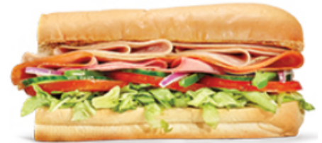
Combiné de viandes froides