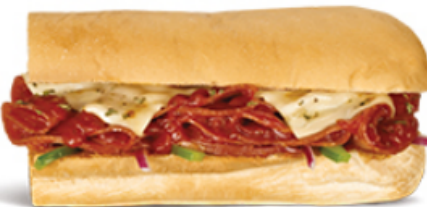
Pizza Sub gratiné