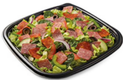
Pizza Sub avec fromage