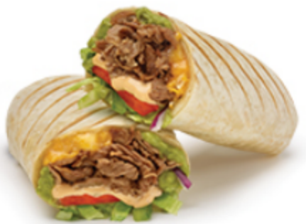
Wrap Signature Steak et guac sud-ouest