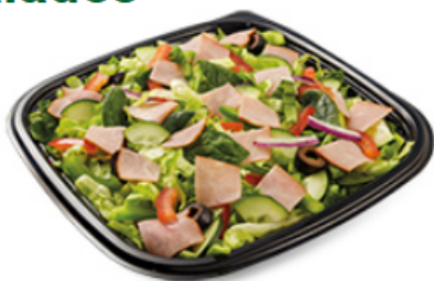
Jambon Forêt Noire