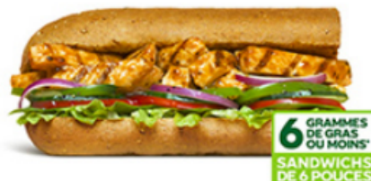
Poulet teriyaki aux oignons doux