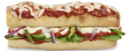
Pizza Sub végétarien