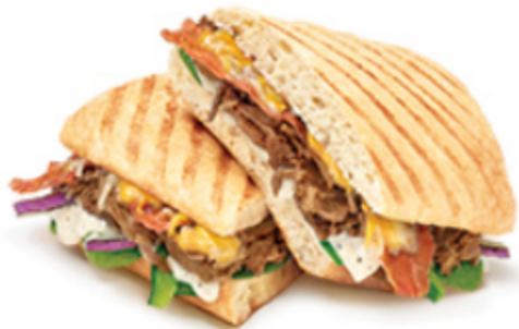
Steak aioli et bacon