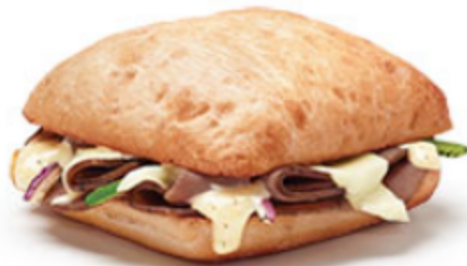
Rapido Grillé au rosbif à 4$