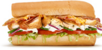
Ranch poulet et bacon gratiné