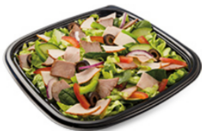
Subway Club □ □