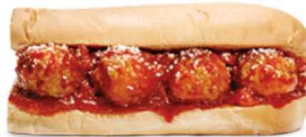
Boulettes de viande marinara