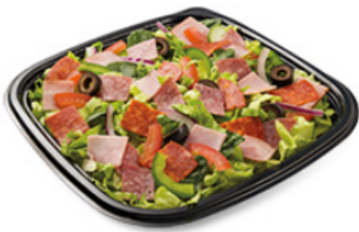
Italien B.M.T. □ □