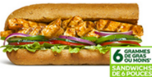
Poulet teriyaki aux oignons doux