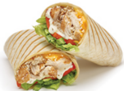
Wrap Signature Poulet César