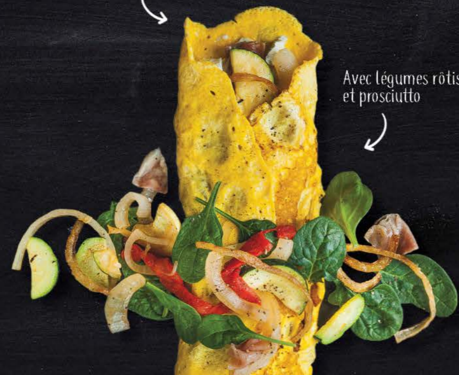
Avec légumes rôtis et prosciutto