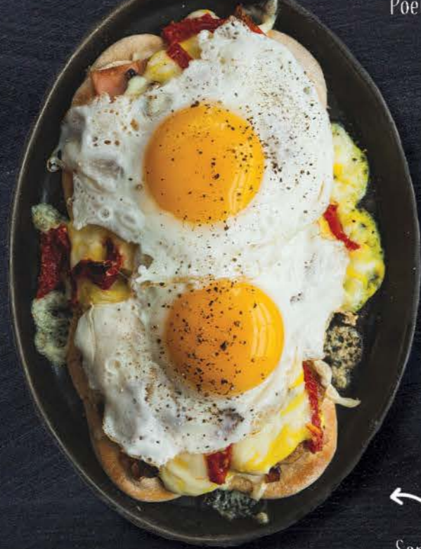
Servi sur pain plat