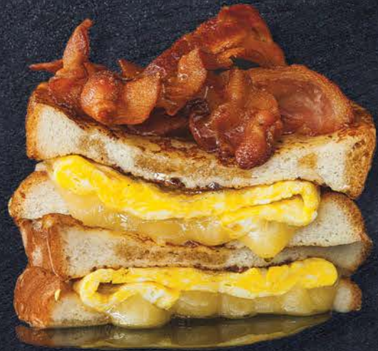
Le sandwich doré